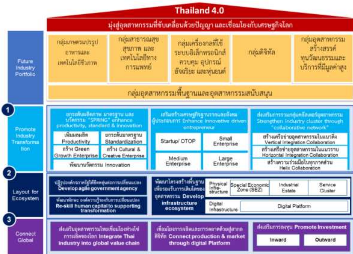
ภาพที่ ๓ : กรอบยุทธศาสตร์เพื่อการขับเคลื่อนอุตสาหกรรมเป้าหมาย

อุตสาหกรรม ๒. การปฏิรูปนิเวศอุตสาหกรรม และ ๓. การเชื่อมโยงอุตสาหกรรมไทยกับเศรษฐกิจโลก ซึ่งมีรายละเอียดของยุทธศาสตร์และกลยุทธ์ต่าง ๆ ดังภาพที่ ๓ และภาพที่ ๔ ตามลำดับ