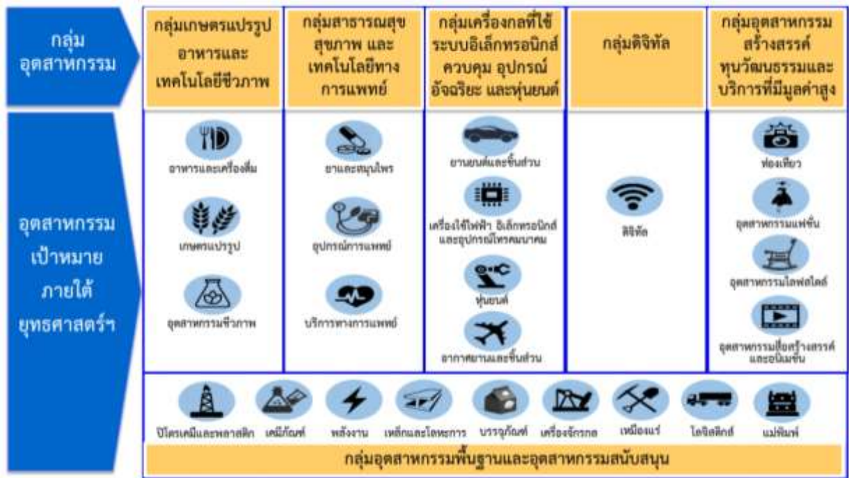
ภาพที่ ๒ : ๑๐ อุตสาหกรรมเป้าหมาย

โดยกลุ่มอุตสาหกรรมเป้าหมายภายใต้ยุทธศาสตร์ฯ จะมุ่งเน้น ๑๐ อุตสาหกรรมเป้าหมายที่เป็นกลไกขับเคลื่อนเศรษฐกิจเพื่ออนาคต ตามที่คณะรัฐมนตรีได้ให้ความเห็นชอบแล้ว (First S-Curve and New S-Curve) โดยจำแนกเป็น ๕ กลุ่มอุตสาหกรรมเป้าหมาย ดังภาพที่ ๒