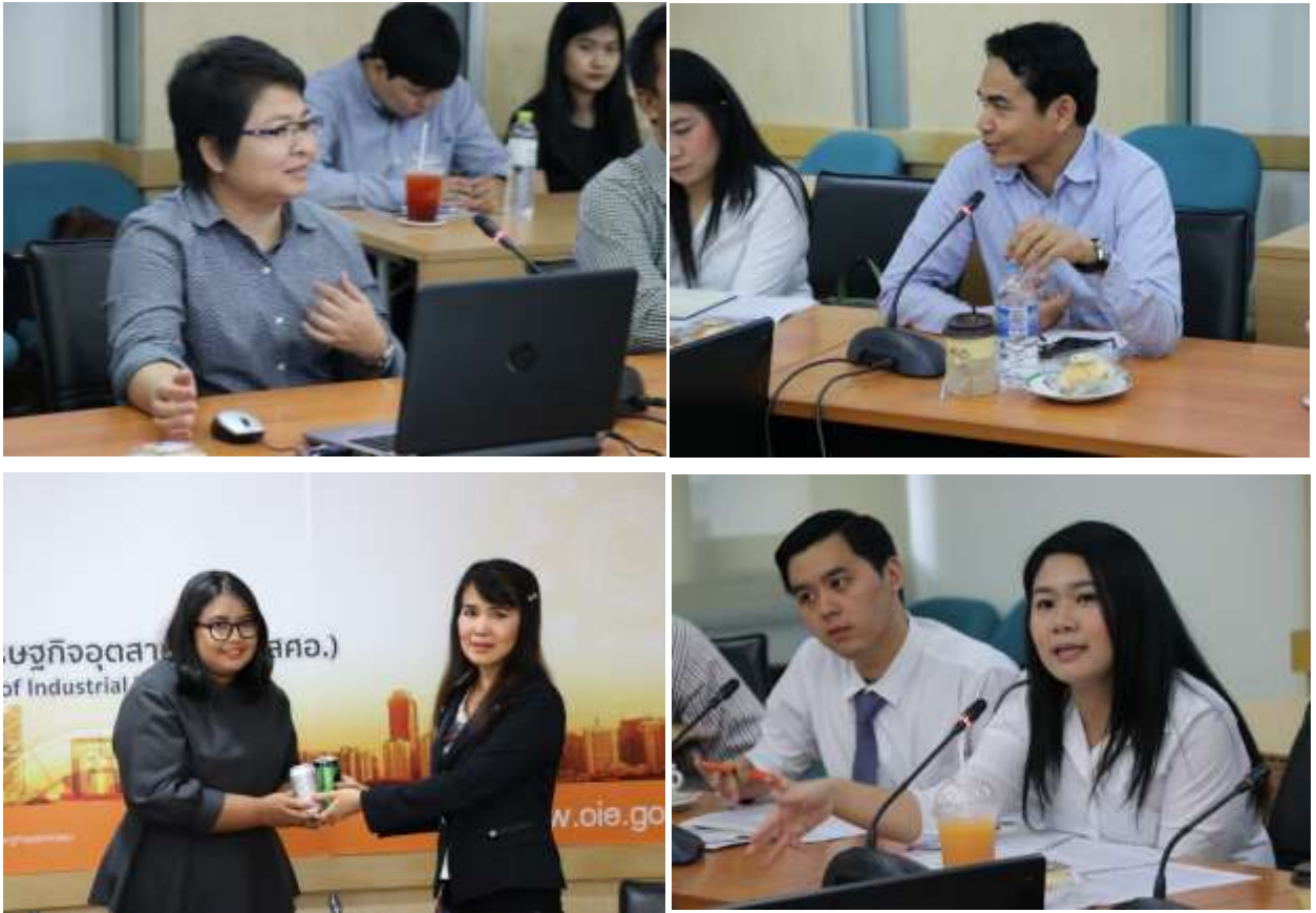
ภาพที่ ๖ : กิจกรรมแลกเปลี่ยนความเห็นกับหน่วยงานต่าง ๆ