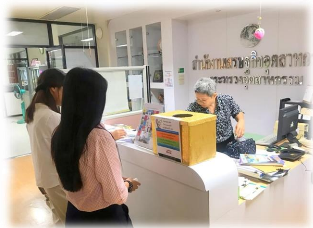
การดำเนินการตามข้อกำหนดและตัวชี้วัด

ที่สำคัญในการให้บริการศูนย์ข้อมูลข่าวสาร สศอ.