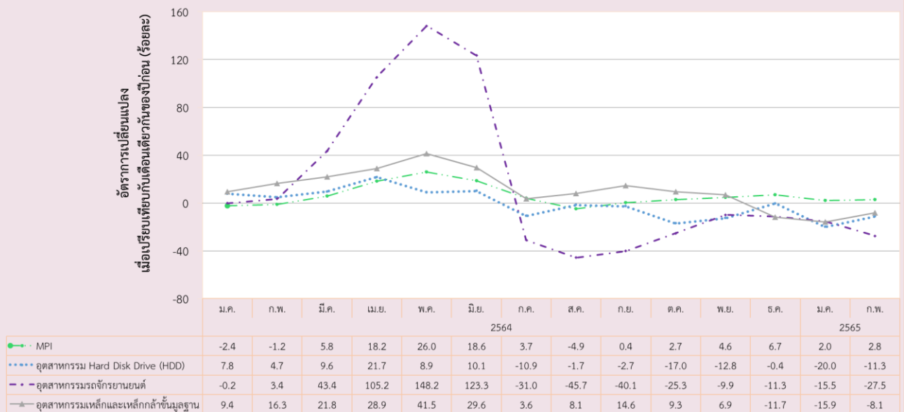
ดัชนีผลผลิตอุตสาหกรรมรายสาขาสำคัญที่หดตัวในเดือนกุมภาพันธ์ 2565

อัตราการใช้จ่ายกำลังการผลิตเดือนกุมภาพันธ์ 2565